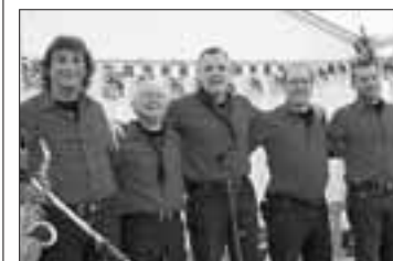
SWISS LÄNDLER GAMBLERS Ils feront fort ce vendredi soir!

La station DRS Musikwelle et la Fédération des producteurs suisses de lait présentent régulièrement l'émission «Zoogä-n-am Boogä». Il s'agit de la diffusion de musique populaire depuis un endroit qui possède le cachet adéquat, par des musiciens de qualité.