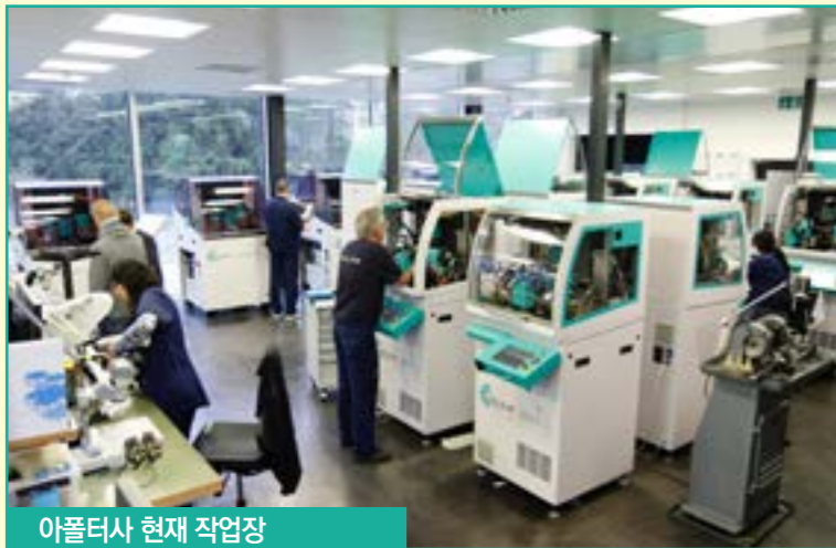
아폴터사 현재 작업장