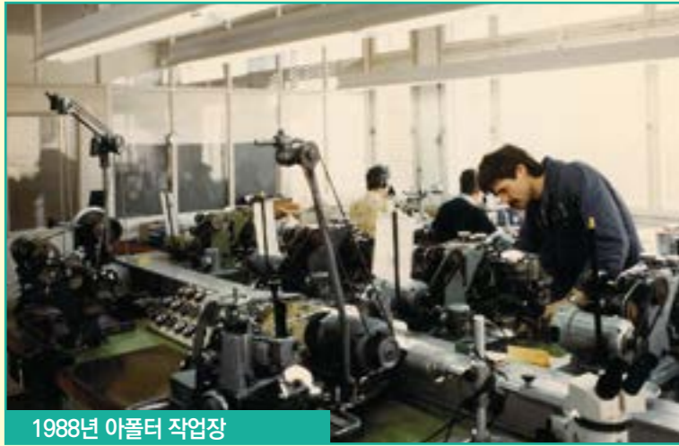
1988년 아폴터 작업장