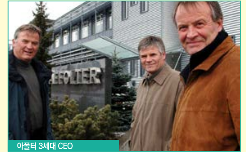
아폴터 3세대 CEO