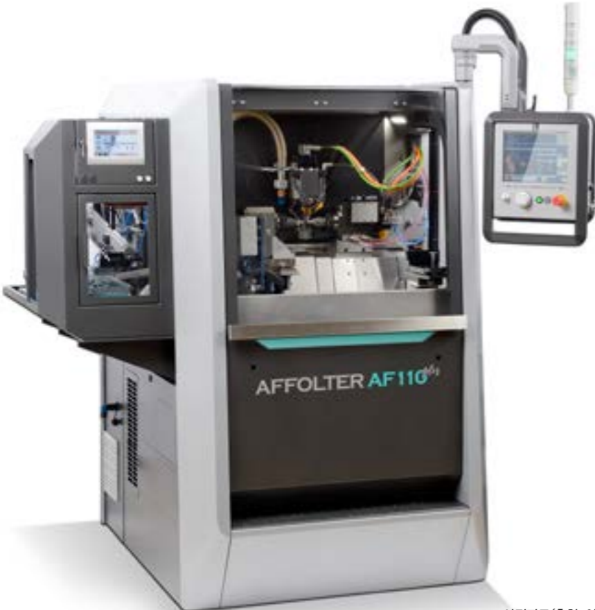
사진자료(출처: 아폴터 테크놀로지 사): 초 정밀 기어 호빙 부문 리더인 스위스 아폴터 테크놀로지 사의 정밀 기어 호빙기

전통과 혁신의 만남. 아폴터 테크놀로지 사는 아폴터 그룹의 계열사로, 현재 글로벌 시장 전체 140명의 직원을 보유하고 있으며 1919년 Louis Affolter에 의해 스위스 Malleray에 설립되었다. 현재는 4세대들이 회사경영을 이끌어가고 있으며 2013년 중국지사가 설립 및 전세계에 유통계약을 통해 제품을 공급하고 있다. 아폴터 테크놀로지 사는 초정밀 기어 호빙 솔루션 분야 글로벌시장 리더로 자리매김하고 있다.