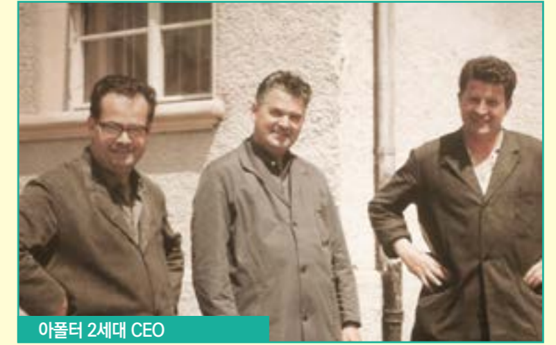
아폴터 2세대 CEO